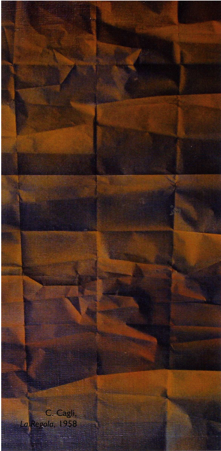
C. Cagli, La Regola , 1958